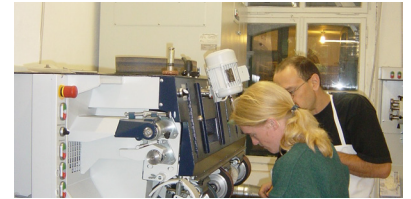
2004 Schuhmacherwerkstatt f. Schuhmacherlernende Atelier A