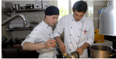
2007 Lehrlingsrestaurant Koch&Kellner Restaurant Schlössli Wörth