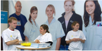
2006 Schaffhauser Berufsmesse Kant. Gewerbeverband