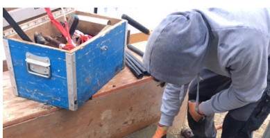
2019 Selbstlernstelle Gartenbau Altra Schaffhausen