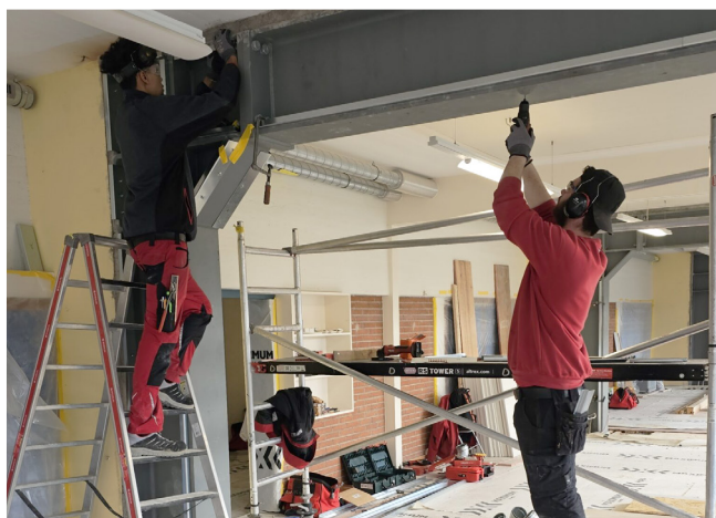
Schule Thayngen. Durch bauliche Neugestaltung entsteht ein neues Raumkonzept und eine neue Lernwelt.

70 Preise, 70 Erfolgsgeschichten – und diese werden wir im Rahmen unserer Preisverleihung am 20. Juni 2025 auch ausführlich feiern. Tragen auch Sie dazu bei mit neuen Ideen, neuen Projekten. Eingabeschluss ist der 30. April 2025.