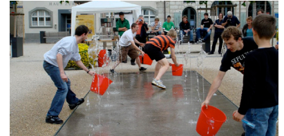
2008 Wasserspiele Herrenacker Stiftung Schaffh. Gesellschaften und Zünfte