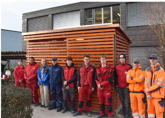
Geräteschopf Schulhaus Beringen. Die Lernenden sind stolz. Von Planung bis Ausführung alles selbst gemacht.

Unter dem Namen „Lernende bauen Zukunft“ startete die Vereinigung Lehrbetriebe im Baugewerbe 2023 mit ihrer Projektreihe. Die Lernenden planen und realisieren dabei eigenständig Bauvorhaben und stärken damit sowohl ihre handwerklichen als auch sozialen Kompetenzen. Angesiedelt sind die vielfältigen Projekte in Schulen und Jugendzentren mit dem Ziel, auch jüngere Schülerinnen und Schüler für das Erlernen eines Fachberufs zu begeistern. Eine prima Idee, nachgerade massgeschneidert für die Zielsetzungen des prix.vision. Damit die wertvolle Projektreihe weiterhin auf Erfolgskurs bleibt, haben wir die Vereinigung sowohl 2023 als auch 2024 zum Projektsieger erklärt.