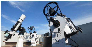
2009 Heliostat f. Sternwarte Naturforschende Gesellschaft