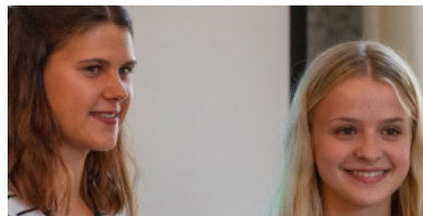
2020 Filmprojekt Annalena Interessensgemeinschaft für die Inklusion beeinträchtigter Menschen