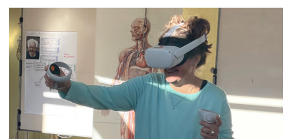
2022 Virtuelle Realität/E-Learning BBZ, Kompetenzzentrum Pflege