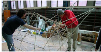
2002 Kreativwoche Verband Schweiz. Schreinermeister