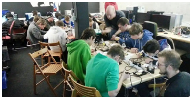
2010 Youth Computerclub, Beringen Verein odenwilusenz