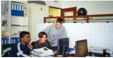
2000 unser 1. Hauptsieger Lehrlingsfirma/Informatik SIG Georg Fischer