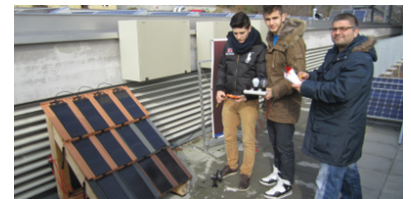
2012 Schaugarten erneuerbaren Energien BBZ